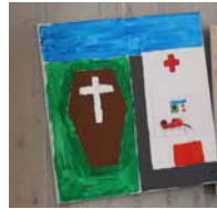
Das Kreuz als Symbol von Beginn und Ende des Lebens.