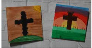
Bunte/Helle Hintergründe für die Hoffnung, die besteht.