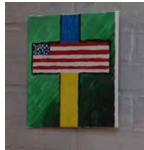
Durchkreuzte Hoffnung, wenn die Macht in den falschen Händen liegt.